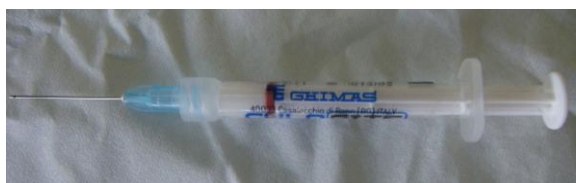
تصویر ۱: سرنگ حاوی ژل کلرهگزیدین با پایه زانتان

جرم‌گیری و آموزش بهداشت دهان در تمام نمونه‌ها توسط یک کلینیسین صورت گرفت، سپس در گروه مورد شستشوی پاکت با آب مقطر انجام شد، پاکت لثه‌ای با کن کاغذی خشک گردید و دندان‌ها با رول پنبه ایزوله شدند. ژل کلرهگزیدین با پایه زانتان Chlo-site (ساخت شرکت Ghimas ایتالیا) توسط سرنگ ۰/۵ میلی لیتری با سوزن ظریف و با انت‌های غیربرنده و سوراخ جانبی که هیچ گونه تحریکی برای پریدونشیوم ایجاد نمی‌کند؛ توسط کلینیسین در پاکت لثه‌ای قرار گرفت. صمغ زانتان یک پلیمر ساکاریدی کراس لینک شده زیست سازگار با خاصیت چسبندگی به بافت است که در تماس با آب به یک شبکه سودوپلاستیک تبدیل می‌شود و قادر به نگهداری و آزادسازی تدریجی مواد مختلف بر اساس ویژگی‌های شیمیایی و فیزیکی آنها است (تصویر ۱). (۲۳) تا مراجعه بعدی هیچگونه درمان پریدونتالی انجام نشد و تمام افراد با شیوه یکسان بهداشت دهان را رعایت نمودند.