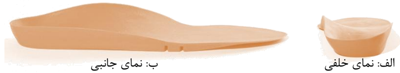
شکل ۱: کفی طبی قوس دار همراه با گوه خارجی استفاده شده در این مطالعه